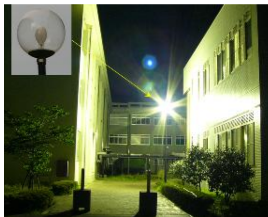
透明なガラスで覆われた「グローブ型」の照明は、周辺や夜空への光漏れと強いグレアで 最悪の照明器具 の一つ